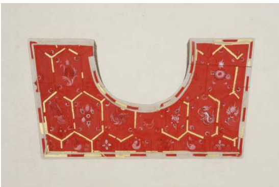
<왕비의 두침 복원모사도>