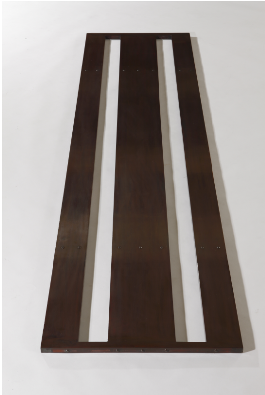
<왕비 시상 복원품>