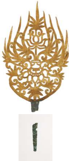
<왕비의 금제관식과 새로 확인한 꽃이 부분>